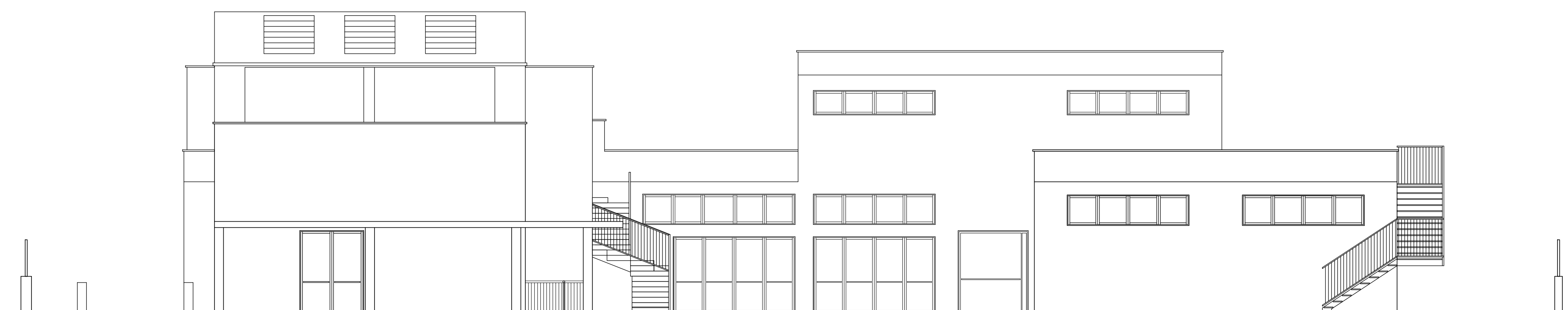
PROSPETTO SUD _ strada SP21 _ PROGETTO ( scala 1.100)